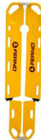
Civière SCOOP EXL