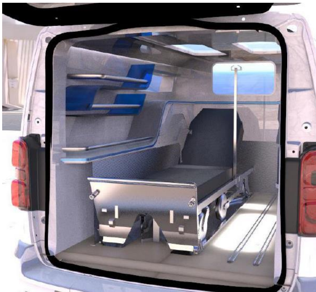
Vue cellule sanitaire (ancrage et brancard en option)

Photos non contractuelles Aménagement en cours de développement