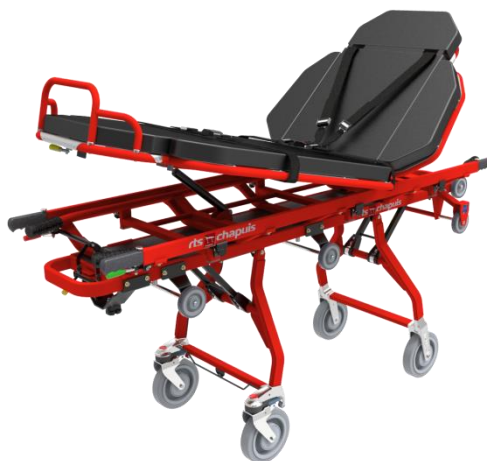
Brancard Chapuis 420 CA XXL