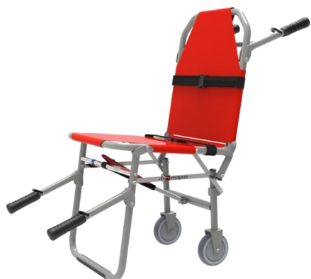
Chaise portoir Chapuis CP 42