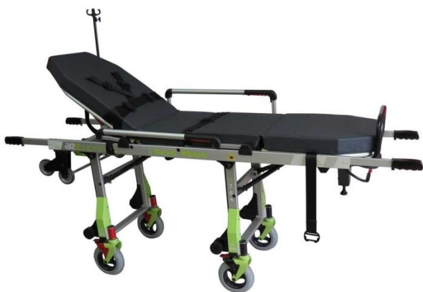
Brancard Ferno M764 « Economique »

Photos non contractuelles Aménagement en cours de développement