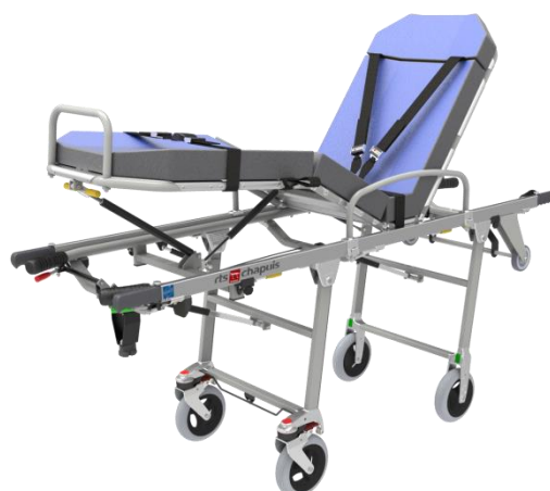
Brancard Chapuis 240 CA « Haut de gamme »