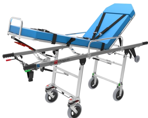
Brancard Chapuis 220 CF M « Standard »