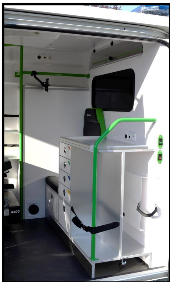
Vue latérale Meuble avec assise médicale fixe