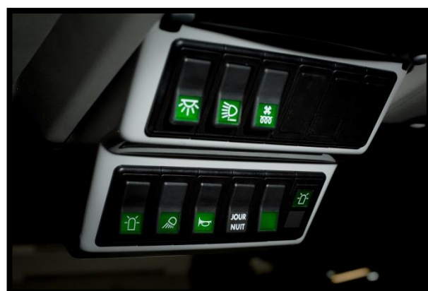
Pupitre de gestion des commandes en cabine