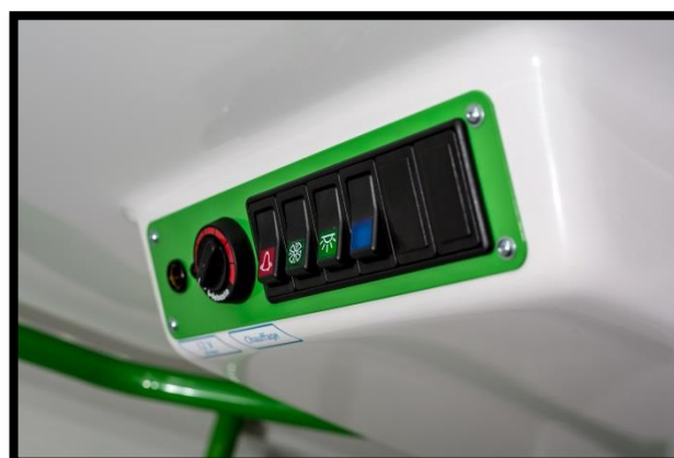
Gestion des commandes en cellule Système de chauffage