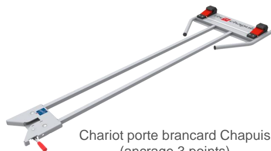
Chariot porte brancard Chapuis (ancrage 3 points)