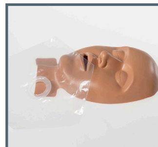
Système hygiénique Ambu