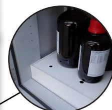
Caillebotis sur bac de rétention (option)