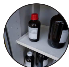
Étagère de rétention réglable en hauteur