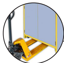
Déplacement par transpalette (à vide)