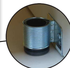
Pieds vérins pour mise à niveau