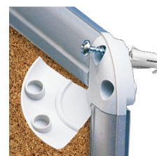
Tableau SB (SHELLBOARD) - 18 A4, alu anodisé / liège / émail e3 blanc feutre

Idéal pour un usage personnel, les bureaux et les espaces partagés.