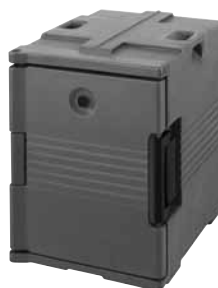
For Camcarrier (UPC400)