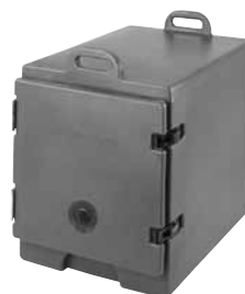
Pour conteneur Camcarrier (300MPC)