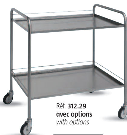
Réf. 312.29 avec options with options

- Piétement en tube acier inox Ø 25 mm - Stainless steel tube base Ø 25 mm