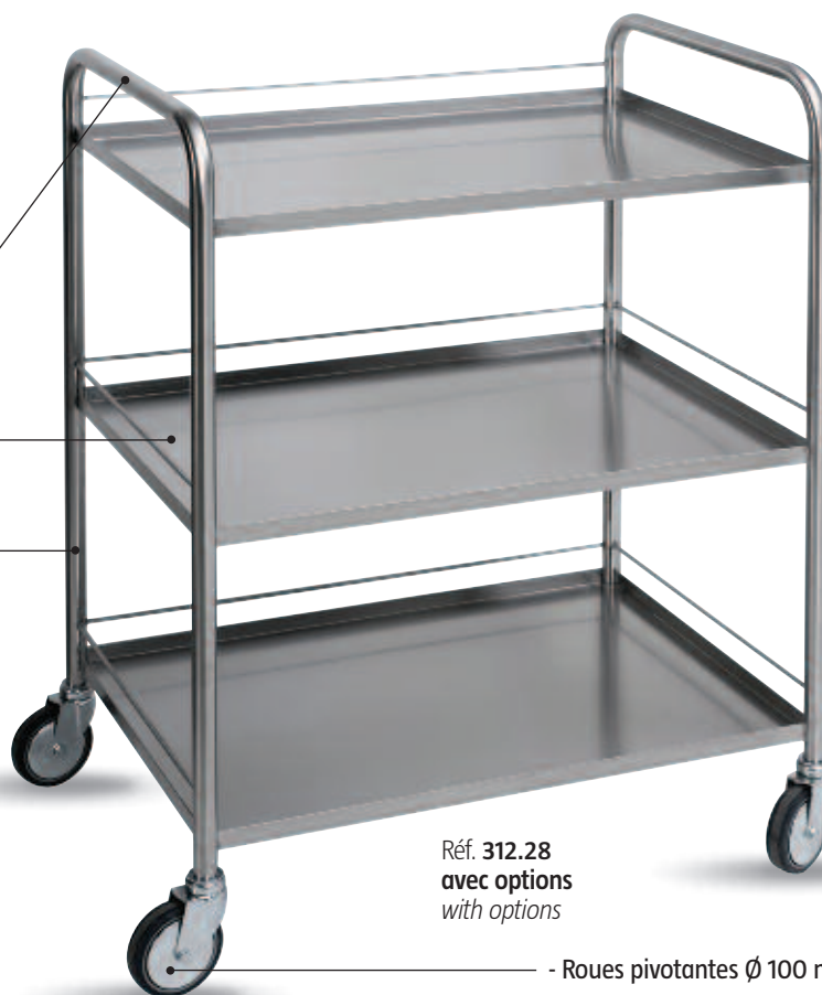
Réf. 312.28 avec options with options

- Roues pivotantes Ø 100 mm - Swivel castors Ø 100 mm