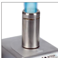
Tête de brûleur longue