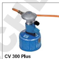
CV 300 Plus