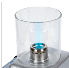
Cloche de protection