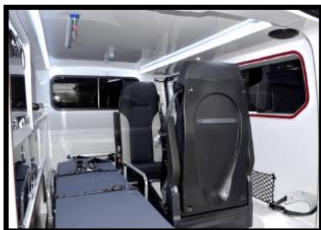
2 nd siège mobile et filet en option