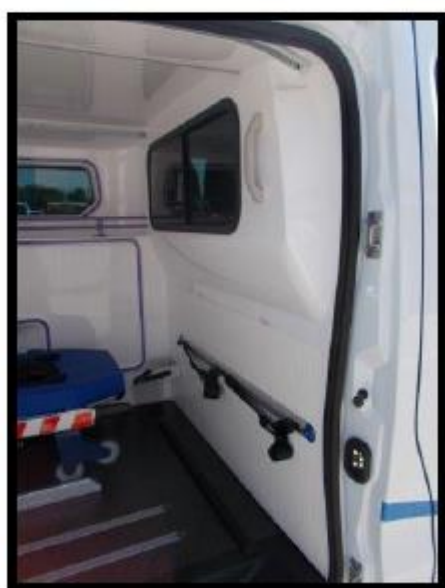
Zone de rangement pour sac de secours et chaise portoir