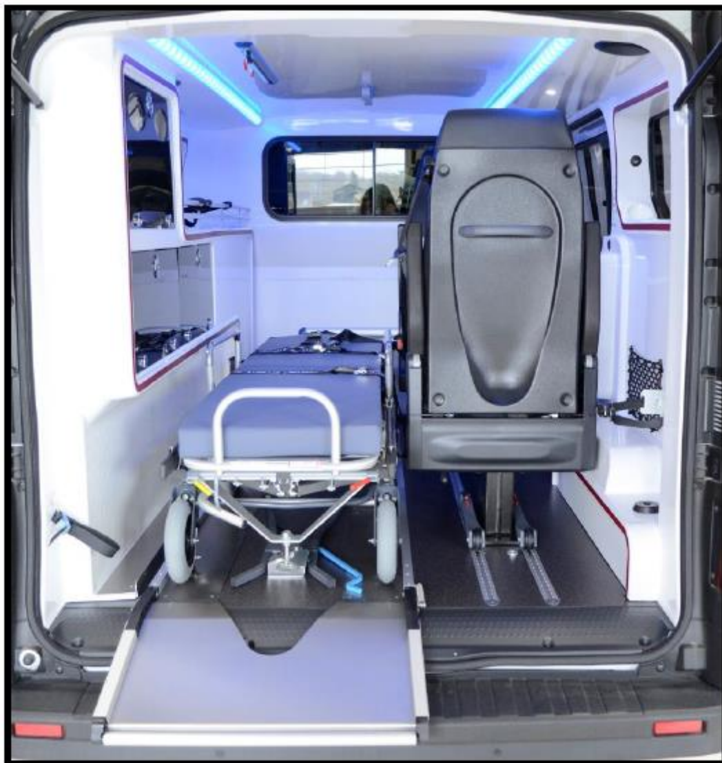
Vue de la cellule sanitaire Ancrage et brancard en option via le marché médical