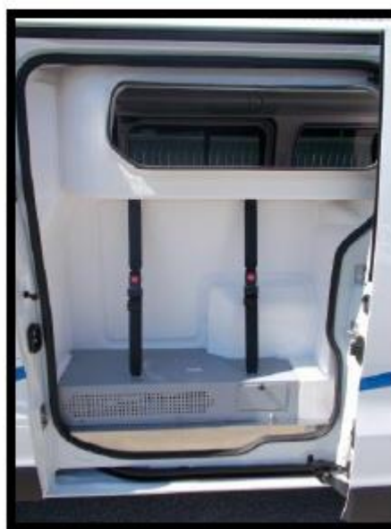
Rangement pour matelas coquille