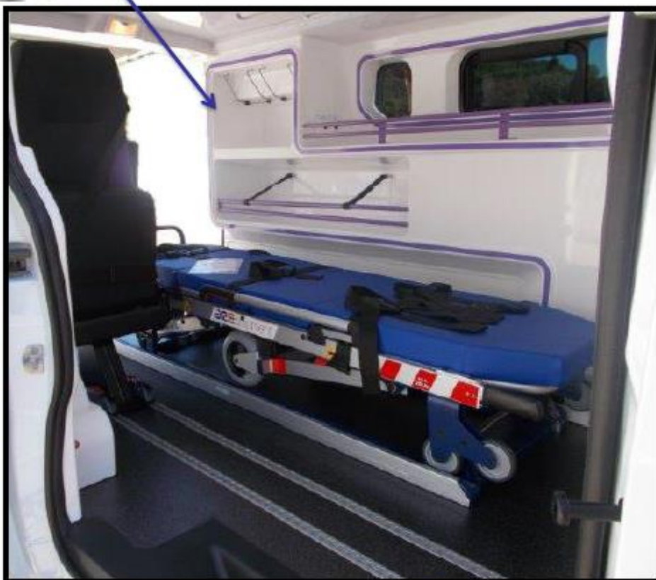
Rails pour mobilité du siège / 2 nd siège en option Ancrage et brancard en option via le marché médical