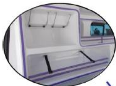
Espaces de rangements et plan de travail