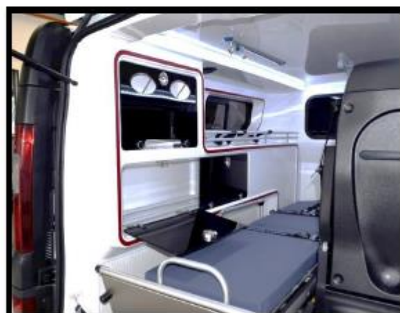
Placards fermés par des plexyglass opaques