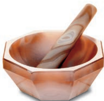
3 agate du Brésil, 1 er choix !