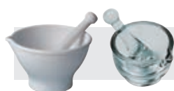
mortier en inox, verre, mélamine p. 1120