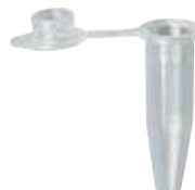
4 microtube pour Vitatron®