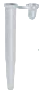
3 microtube pour Beckman®