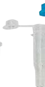
5 microtube pour Cobas®