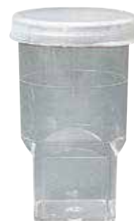
11 godet pour Coulter-Counter®