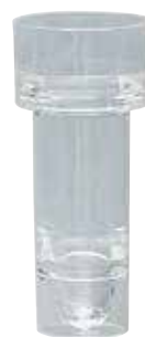
10 godet pour Hitachi®