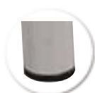
Embouts non tachants et non marquants (polyéthylène).