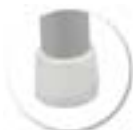
Embouts non tachants et non marquants (polyéthylène).