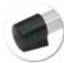
Embout coiffants non tachants et non marquants (polyéthylène).