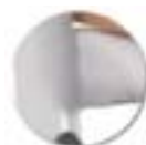
Soudure haute résistance avec apport de métal