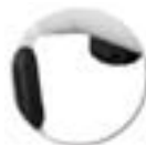
Butée appui sur table + protection angle du plateau de table