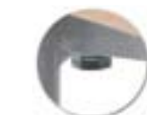
Montage rapide (1 vis).