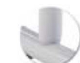
Soudure haute résistance avec apport de métal