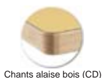
Chants alaise bois (CD)