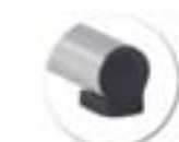
Embout à talon, non tachant, non marquant (polyéthylène).