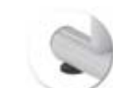
Vérins de réglage