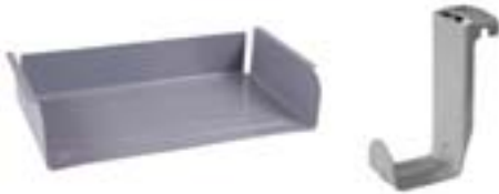
Option : casier tôle à visser gris 7037 et/ou crochets porte cartables.