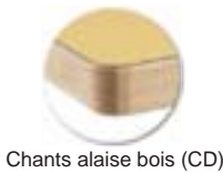
Chants alaise bois (CD)

Ne pas utiliser: Solvant cétonique; Pâtes et crèmes abrasives; Détergents (ne pas gratter).