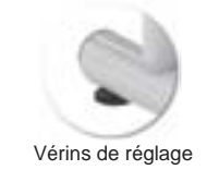
Vérins de réglage