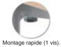
Montage rapide (1 vis).