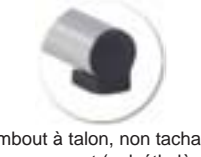
Embout à talon, non tachant, non marquant (polyéthylène).