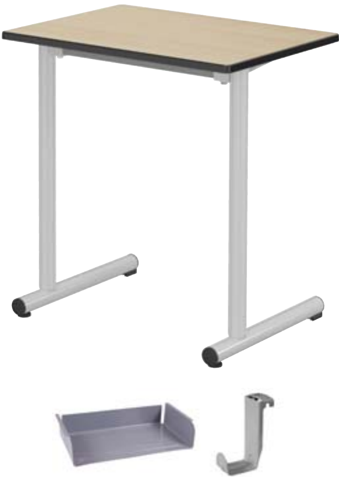
Option : casier tôle à visser gris 7037 et/ou crochets porte cartables.