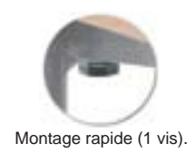
Montage rapide (1 vis).