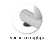
Vérins de réglage