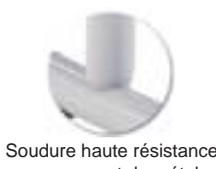
Soudure haute résistance avec apport de métal