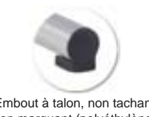
Embout à talon, non tachant, non marquant (polyéthylène).