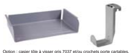
Option : casier tôle à visser gris 7037 et/ou crochets porte cartables.