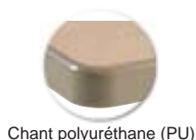
Chant polyuréthane (PU)