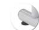
Vérins de réglage