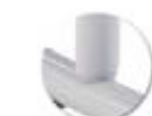
Soudure haute résistance avec apport de métal