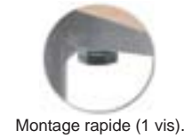
Montage rapide (1 vis).