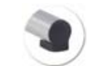
Embout à talon, non tachant, non marquant (polyéthylène).