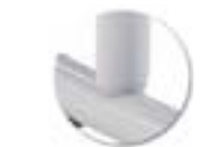
Soudure haute résistance avec apport de métal