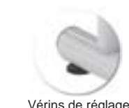
Vérins de réglage