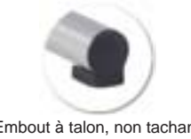
Embout à talon, non tachant, non marquant (polyéthylène).