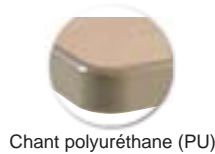
Chant polyuréthane (PU)