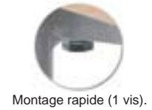
Montage rapide (1 vis).