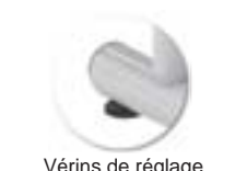
Vérins de réglage