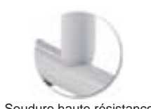
Soudure haute résistance avec apport de métal