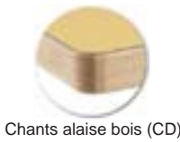
Chants alaise bois (CD)

Ne pas utiliser: Solvant cétonique; Pâtes et crèmes abrasives; Détergents (ne pas gratter).