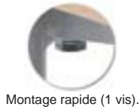
Montage rapide (1 vis).