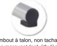
Embout à talon, non tachant, non marquant (polyéthylène).