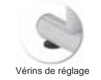
Vérins de réglage