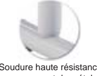
Soudure haute résistance avec apport de métal