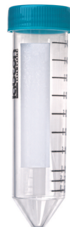
Gamme Perform R™