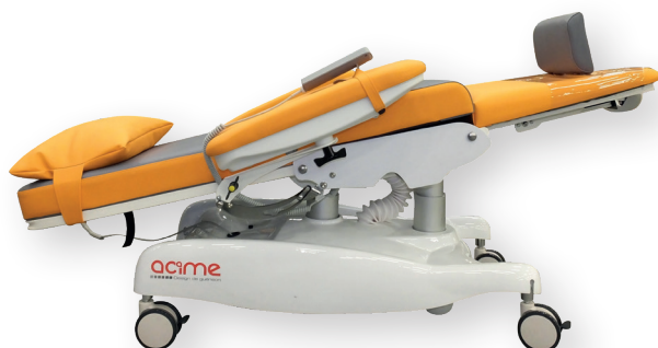
Déclive de confort ou d'urgence