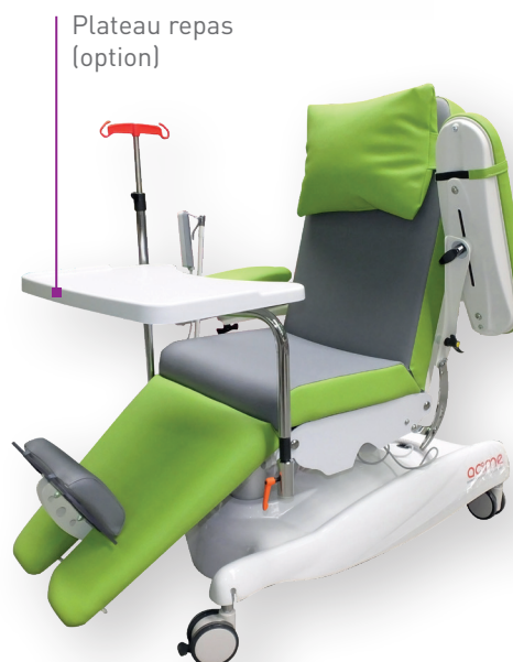
Plateau repas (option)