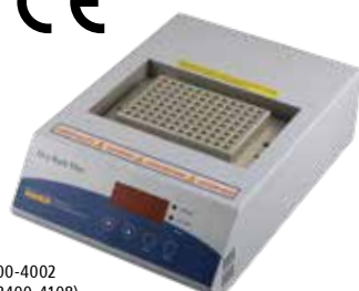
N2400-4002 (avec N2400-4108)