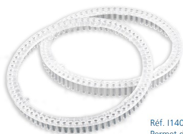
Réf. I1402-0500 Permet de réaliser 1728 réactions.