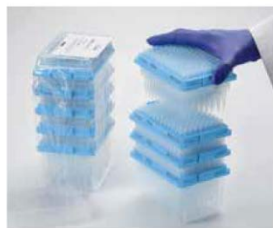
Enlever les plateaux de la refill