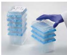
Refermez la refill entamée