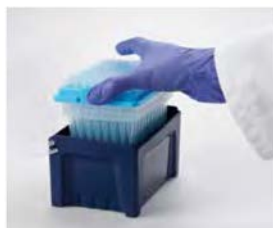
Recharger le rack