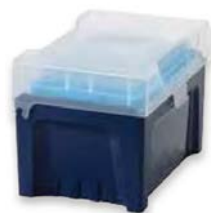
Fermez le couvercle, c'est terminé