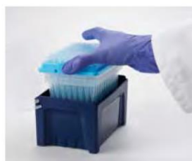
Recharger le rack