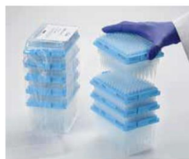
Enlever les plateaux de la refill