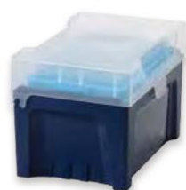
Fermez le couvercle, c'est terminé