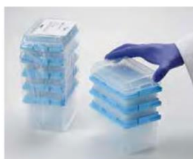
Refermez la refill entamée