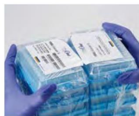
Séparer la refill