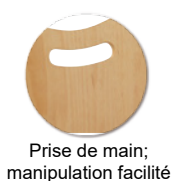
Prise de main; manipulation facilitée