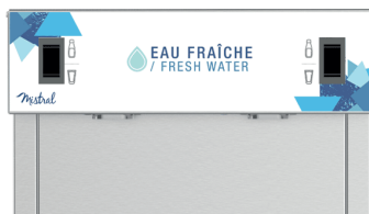
Buses de distribution interne pour éviter tout risque de bio-contamination

Compatible avec le système anti-fuite Watersafe® (en option)