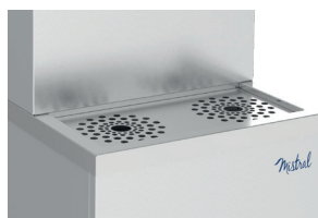
Grille inox pour poser les carafes