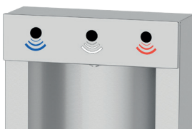
3 capteurs infrarouges pour une distribution d'eau sans contact