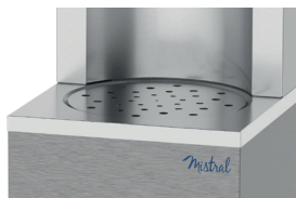
Grille inox pour carafes