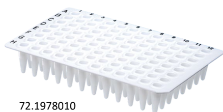
72.1978010 Sans jupe