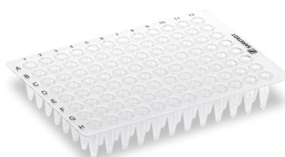
72.1978 Sans jupe