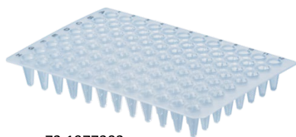
72.1977202 Sans jupe