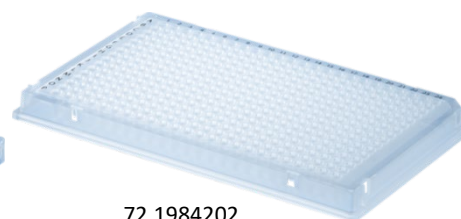
72.1984202 Jupe intégrale

Désignation commerciale : Plaque PCR Multiply®