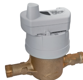
Compteur d'eau Aquadis+ équipé du module Everblu Cyble Enhanced