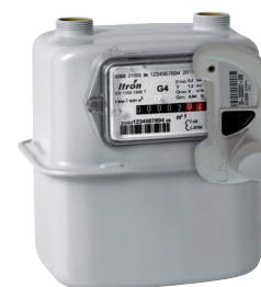
Compteur de gaz Gallus équipé du module Everblu Cyble Enhanced

Le module compact Everblu Cyble Enhanced, grâce à la technologie Cible brevetée, transmet parfaitement l'index mécanique du compteur d'eau (prise en compte des éventuels retours d'eau). Il filtre toute impulsion parasite générée, par exemple, par la vibration d'une canalisation.