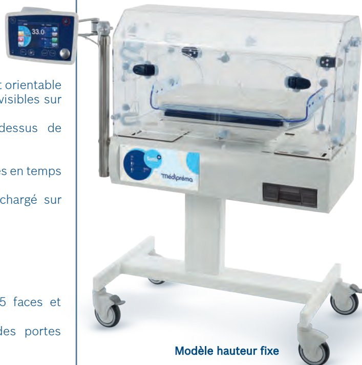
Modèle hauteur fixe