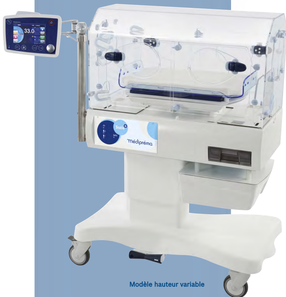
Modèle hauteur variable

Médipréma l'a bien compris et offre avec Satis+ une ergonomie adaptée aux soins intensifs, une efficacité thermique et une qualité d'humidification sans compromis sur le confort de l'enfant.