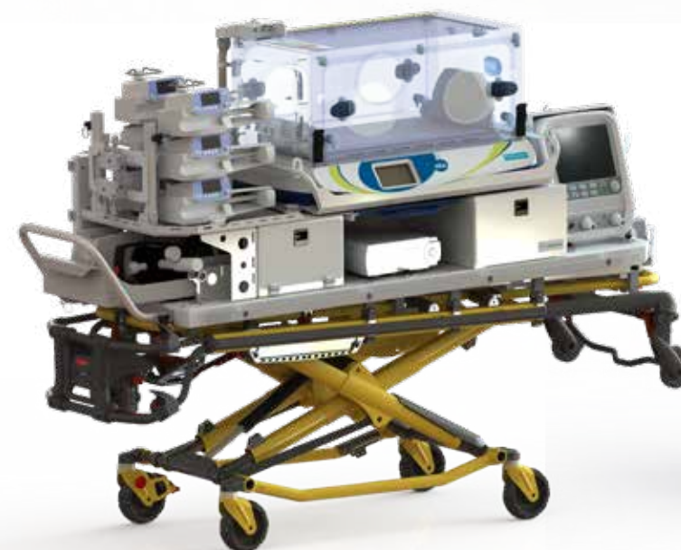
Médicruiser : transport terrestre