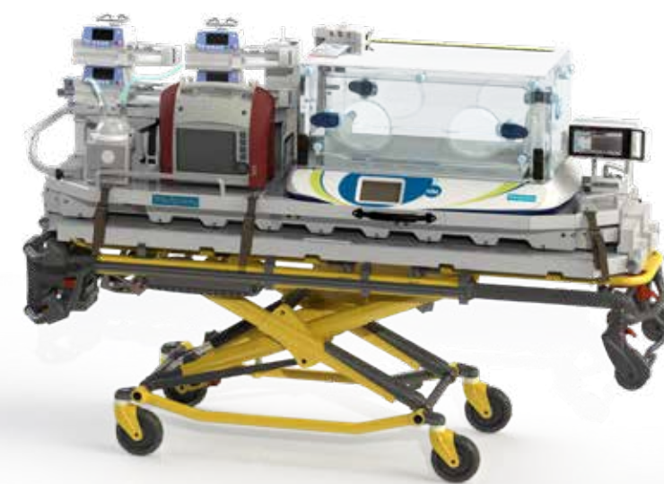
Hélipréma : transport hélicoptère