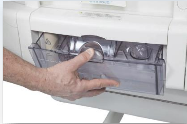
Accès au bac d'humidification