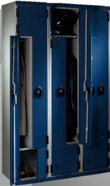
Réf UGAP 3134214 Réf four. VOLS3S