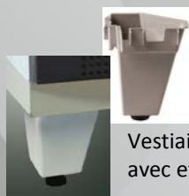
Vestiaires disponibles avec et sans pied

Le procédé de profilage agrafage Seamline® renforce la résistance des montants, équivalent à une tôle ép. 10/10 ème pliée.