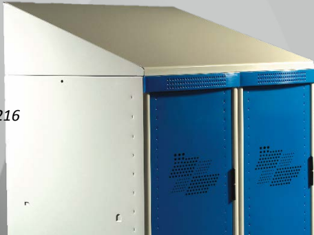
Réf UGAP 3134216 Réf four. CSB2--