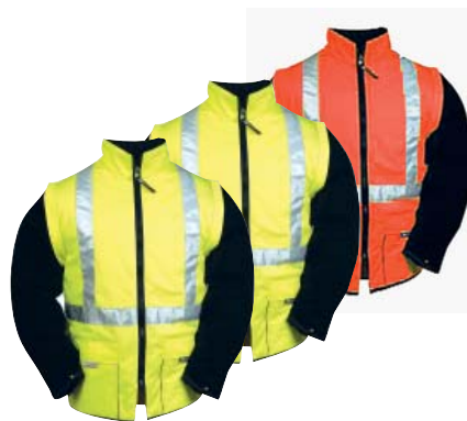
Blouson intérieur avec manches amovibles