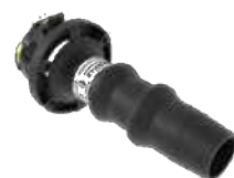
Adaptateur mousse BF ou MF