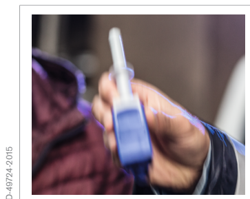
3. Secouez le kit de test.