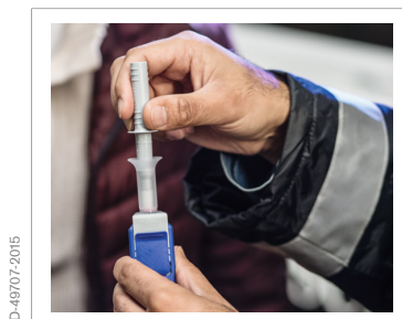
2. Insérez le collecteur dans l'entonnoir.