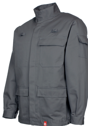
Gris Acier 20