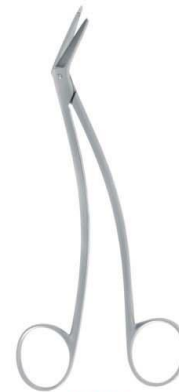
B25820 17 cm - 6 3/4"