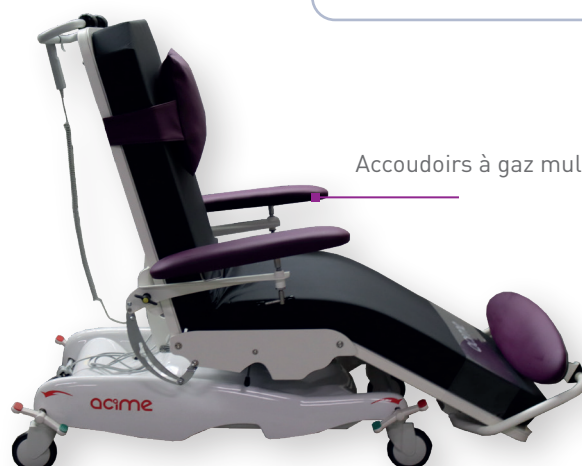
Accoudoirs à gaz multi-positions

4 roues Ø200 mm à freinage centralisé Batterie d'autonomie Sangle de sécurité Coloris hors standard Filet porte dossier Lampe de lecture led articulée Plateau repas 600 mm x400 mm avec support Porte rouleau drap d'examen Tige à sérum simple Tige à sérum télescopique