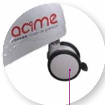
Freinage centralisé ou indépendant